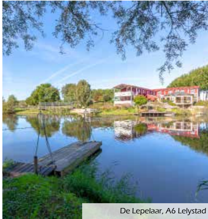
De Lepelaar, A6 Lelystad

Boven het restaurant van de Lepelaar zijn in 2018 veertien comfortabele hotelkamers gerealiseerd allen voorzien van airconditioning.