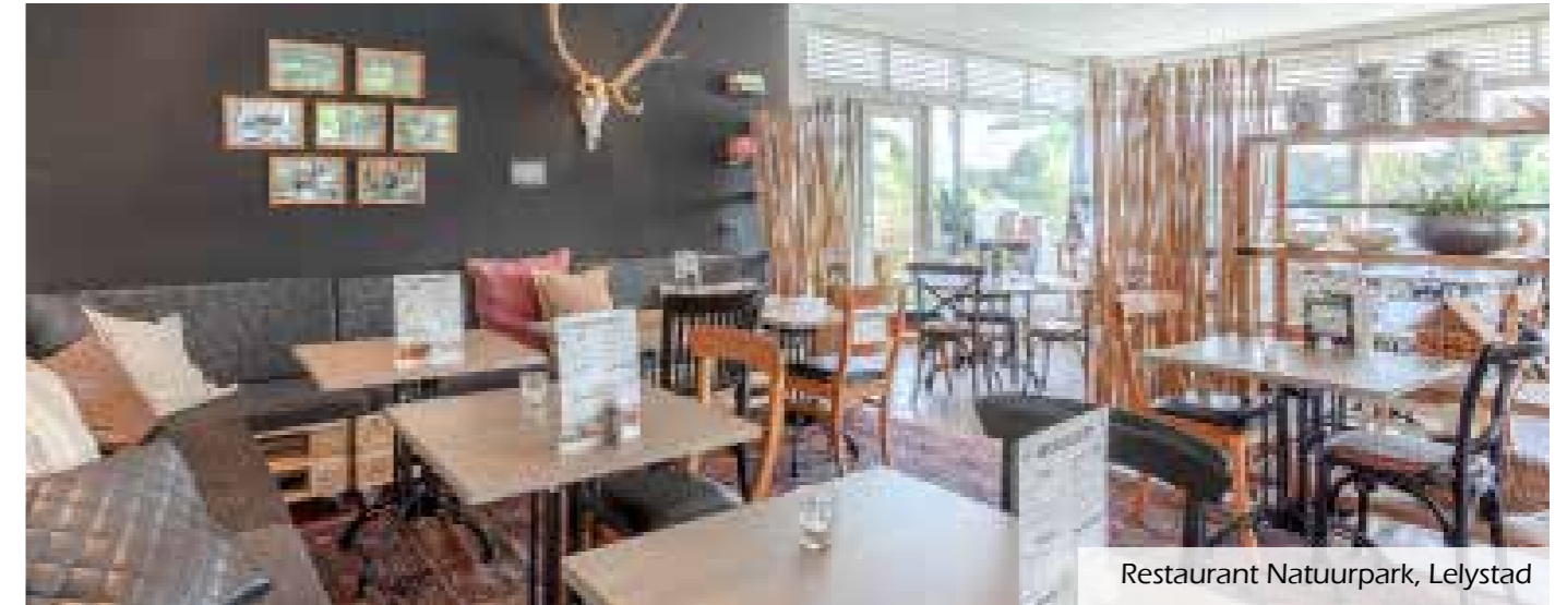
Restaurant Natuurpark, Lelystad

Alle Hajé Take Away's werken met pure, verse en zo veel mogelijk eerlijke ingrediënten. U vindt onze Take Away's bij onze locaties langs de A6 & A28.