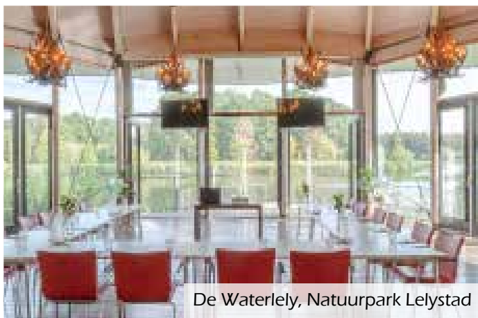
De Waterlely, Natuurpark Lelystad