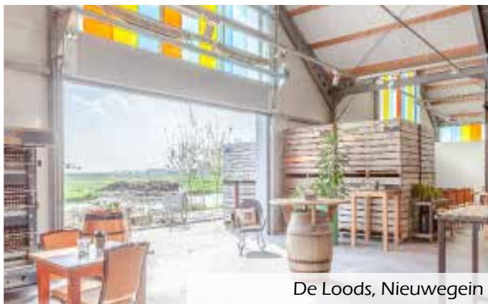
De Loods, Nieuwegein